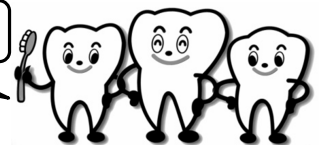
歯周疾患キャラクター「歯みんぐ」