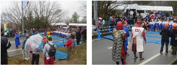
第16回九度山世界遺産マラソン