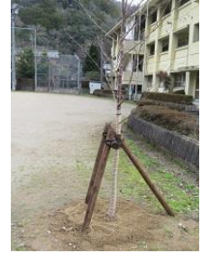
中学卒業記念に桜を新たに植樹