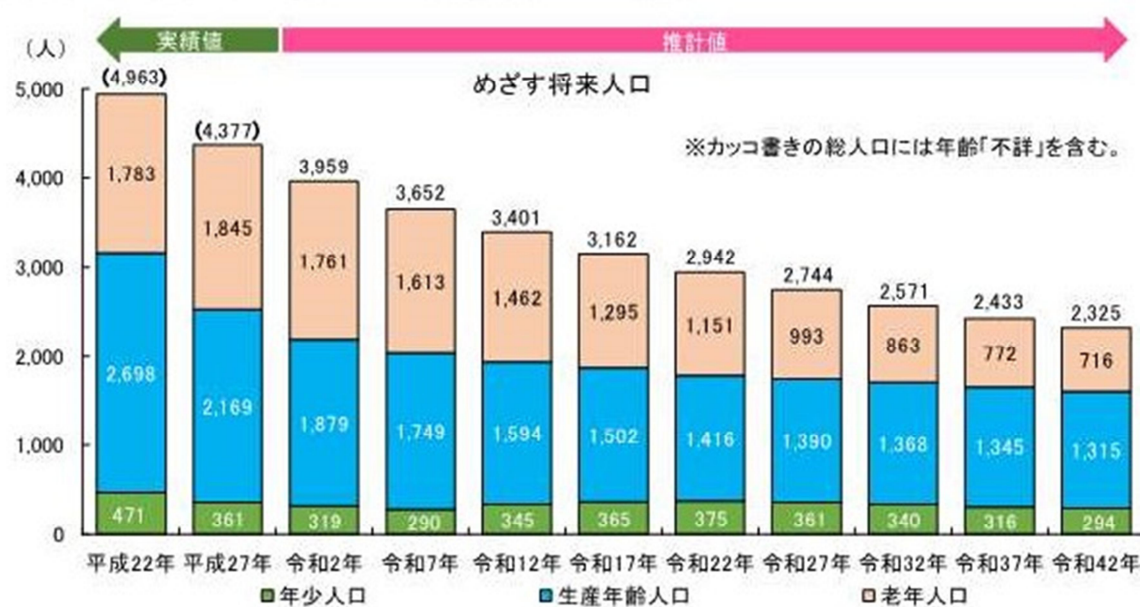
表1-1 (2) 人口の見通し