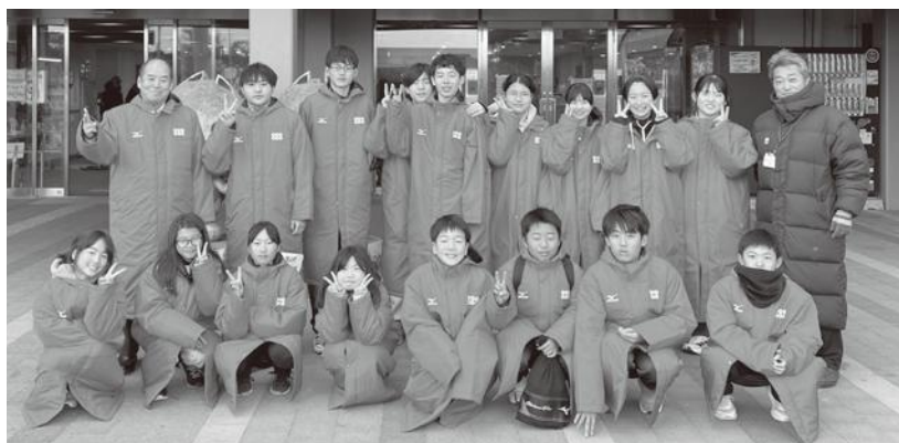
▲九度山町駅伝チーム

当日は、チーム一丸となって日頃の練習の成果を発揮すべく、一生懸命たすきを繋げました。