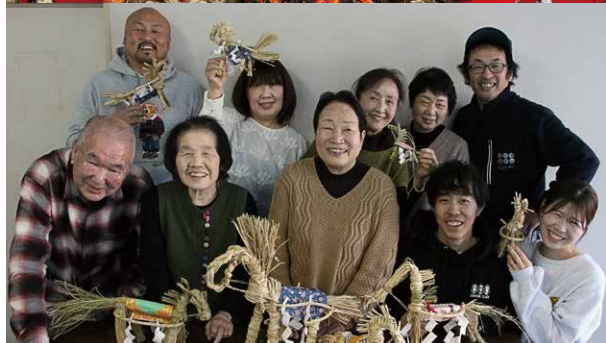
◀住民クラブのみなさん