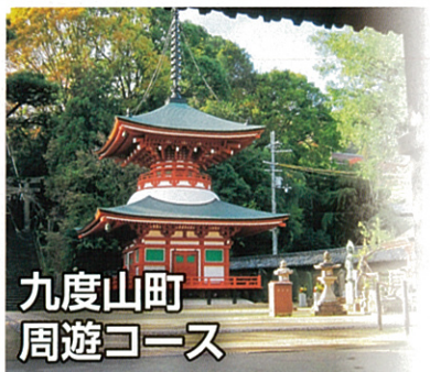
九度山町 周遊コース