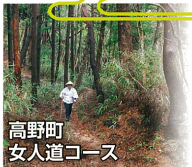
高野町 女人道コース