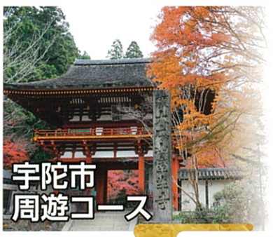
宇陀市 周遊コース