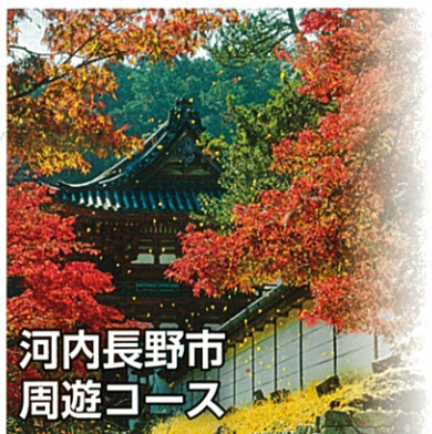
河内長野市 周遊コース