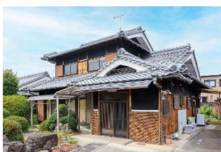
民家型デイサービスまりっくす