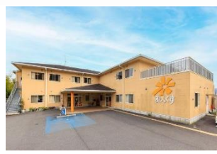
・シニアヴィラジュレ橋本 ・ジュレデイサービス