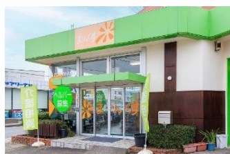
まりっくすサービスセンター本部