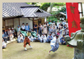
10月：えびすのお祭り

丹生官省符神社で執り行われる例大祭。舞の奉納や社中の踊り、もち投げなど趣向を凝らした祭りです。