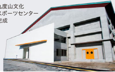
九度山文化 スポーツセンター 完成