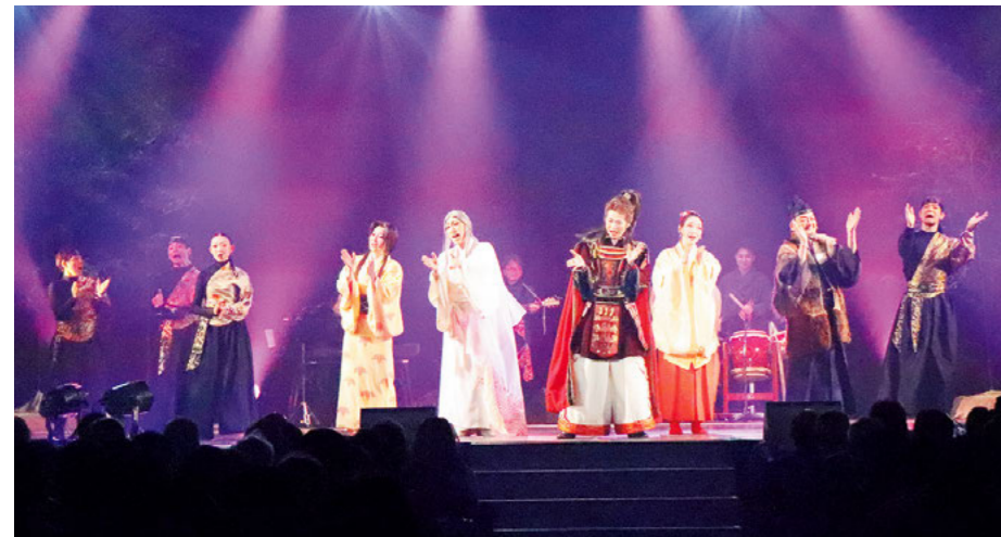
新町制施行70周年記念公演