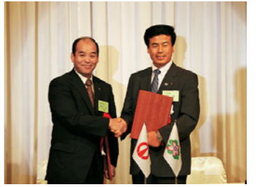
上田市との姉妹都市連携