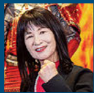
漫画家 尼子騷兵衛