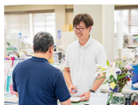
地域包括支援センター