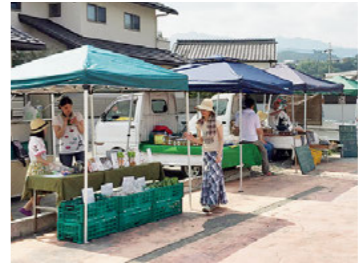
九度山町まちなか軽トラ市