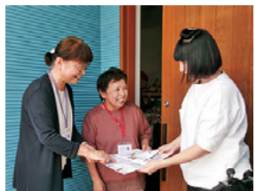
家庭教育支援チーム「きらら」