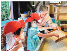
体験学習(紙遊苑で和紙すき)