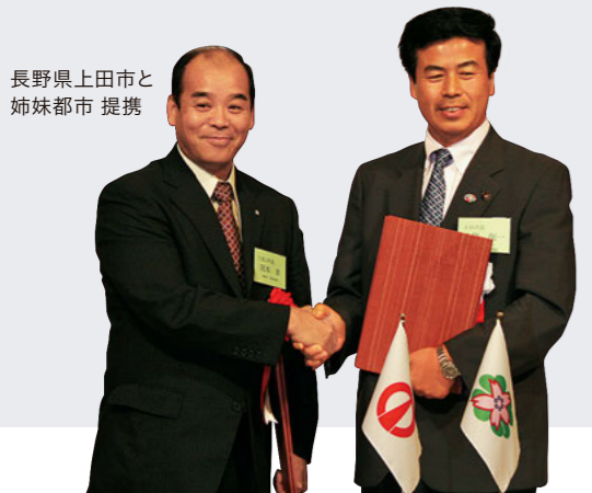
長野県上田市と 姉妹都市 提携