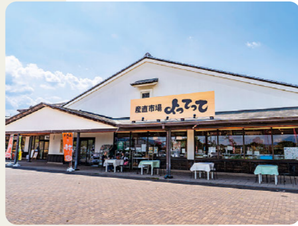
道の駅 柿の郷くどやま

地域の交流促進や観光振興の取り組みとして、施設の整備やイベントの開催、広域での連携を実施しています。紀の川のほとりに建設された道の駅は、観光客の誘致だけでなく、買い物難民対策や防災拠点として整備。また、真田ゆかりの地のつながりで、長野県上田市と姉妹都市連携を締結し、町内外の交流を活性化させています。