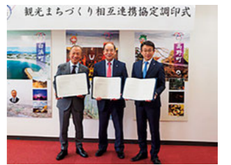
観光まちづくり相互連携協定