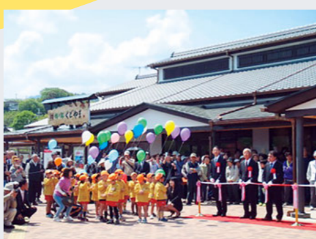
道の駅「柿の郷くどやま」オープン